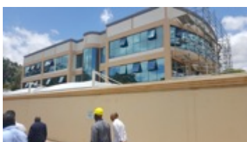
EMBAIXADA DE ANGOLA, assistência à arquitectura | Botswana