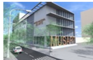
MUSART | Maputo