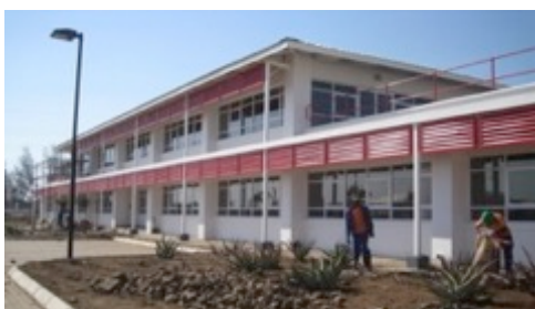
BARLOWORLD, escritórios e oficinas | Matola