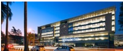
STANDARD BANK, nova sede | Maputo