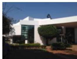
Graça Machel, reabilitação | Maputo