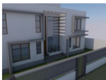
RESIDÊNCIA M. Pitroco | Maputo