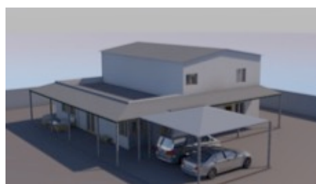
VOICES OF THE WORLD | Matola