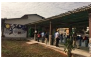
CERCI MAPUTO, escola especial | Maputo