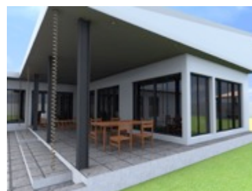
RESIDÊNCIA R. Ribeiro | Belo Horizonte