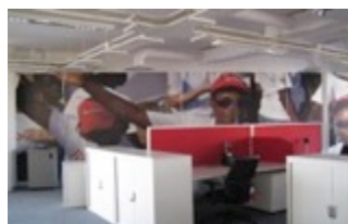
RIO TINTO, escritórios | Maputo