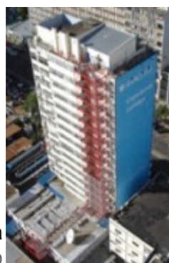
BARCLAYS BANK, escada de emergência | Maputo