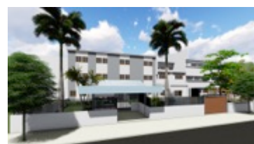
UNICEF, reabilitação | Maputo