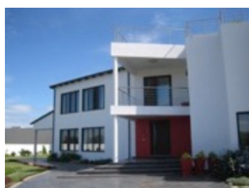
RESIDÊNCIA G. Murta | Belo Horizonte