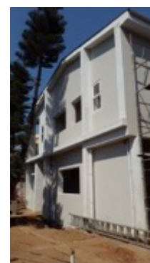
MIA KHAYA GUEST HOUSE | Maputo