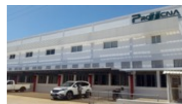
PROTECNA, revitalização | Maputo